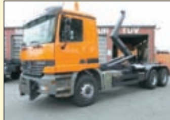
(22407) Mercedes Benz 3340 6x4 (E2+G1)

EZ: 11/1990, zul. Gesamtgewicht: 26.000 kg, Nutzlast: 12.830 kg, abgel. Km-Stand: 421.334 km, Federung: Blatt, Aufbau: Meiller Typ RK19.65 für bis 6,5 mtr Container, 20.000 kg Hubkraft, Schubarm, hydr. Containerverriegelung, Innenbedienung, ABS, ASR, AP-Achsen, Längs- u. Quersperren, AHK + 2-Leiter Luftanschluss, Duomatik Luftanschluss