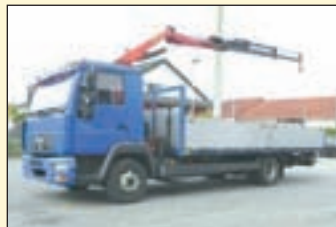
(22364) MAN LE 8.220 (Euro3+G1)

Pritsche/Kran EZ: 04.2005, zul. Gesamtgewicht: 7.490 kg, Nutzlast: 2.530 kg, abgel. Km-Stand: 209.520 km, Federung: Blatt/Luft, Aufbau: Pritsche (5,6m), Kran: Palfinger PK 3800, faltbar, re/li Bedienung, 2x hydr. Ausschub + 1x man. Ausschub, 6-Gang-Getriebe, ABS, Diff.-Sperr HA, Kugelkopf AHK etc.