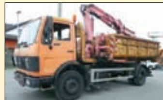
(22451) Mercedes Benz 1622 Abrollkipper mit Kranmulde EZ: 10.1987, zul. Gesamtgewicht: 17.000 kg, Nutzlast: 8580 kg, abgel. Km-Stand:285.840 Federung: Blatt, Aufbau: Atlas Abrollkipper ARK 122 für bis 5 mtr Containerlänge, 12.000 kg Hubkraft, Knickarm, Innenbedienung, Servo,6-Gang Getriebe Diff.-Sperrung, AHK+2-leiter Luft, etc. Auf Wunsch dazu (22452) 11 m³ Abrollcontainer mit Kran: Atlas AK 4003 C (Bj. 88), faltbar, 2-fach hydraulischer + 3-fach manueller Ausschub, Flursteuerng + Kabellernbedienung, 6.+ 7. Steuerkreis für Dreh servo- u. Greiferbetrieb. Hebt bei 2.04m-6t, 4.6m-2.63t, 6.3m-1.88t, 8m-1.45t, 9.67m-1.15t, 11.27m-0.85t, 12.87m-0.60t.