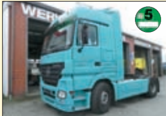
(22409) Mercedes Benz MP II 1846 (E5+G1) Sattelzugmaschine/Megaspace + Kipphydraulik

EZ: 05.2007, abgel. Km-Stand: 519.150 km, Federung: Blatt/Luft, Jost Sattelplatte, Megaspace Fhs/2x Liege, ABS, ASR, Berganfahrhilfe, Standheizung, Klima, Retarder, elektr. Ausstelldach, Radio, Bordcomputer, Diff.-Sperrung HA, Dach + Seitenspoiler, 2x Alutank, 450 + 550 l Tank etc.