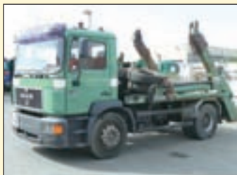
(22282) MAN 18.264 (E2+G1) Absetzkipper EZ: 11/1997, zul. Gesamtgewicht: 18.000 kg, Nutzlast: 8.245 kg, abgel. Km-Stand: 501.092km, Federung: Blatt, Aufbau: Gergen TAK 20 C, teleskopierbar, 13.000 kg Hubkraft, Innen- u. Außenbedienung. ABS, EDC, Diff.-Sperrung HA, AHK 2-Leiter Luftanschluss, Duomatik Luftanschluss