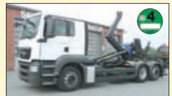
(22281) MAN TG-S 26.440 6x2 (E4+G1) Abrollkipper EZ: 08/2008, zul. Gesamtgewicht: 26.000 kg, Nutzlast: 15.050 kg, abgel. Km-Stand: 132.382 km, Federung: Blatt/Luft, Aufbau: Palfinger Palift T 20 für bis 6.5 mtr Container, 20.000 kg Hubkraft, Schubarm, Innenbedienung, hydr. abklappbarer Unterfahrerschutz ht. ABS, ASR, Klima, Liftachse, Diff.-Sperrung HA, AHK 2-Leiter Luftanschluss