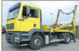
(22448) MAN TG-A 18.310 (E3+G1) Absetzkipper EZ: 06/2004, zul. Gesamtgewicht: 18.000 kg, Nutzlast: 7.600 kg, abgel. Km-Stand: 272.235 km, Federung: Blatt/Luft, Aufbau: Palfinger Absetzkipper Palift PAK 12 T (System Meier), teleskopierbar, 12.000 kg Hubkraft, Innen- u. Außenbedienung. ABS, ASR, Klima, Radio, Diff.-Sperrung HA, AHK 2-Leiter Luftanschluss.