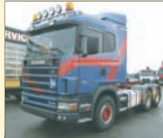
(20379) Scania R164/480 (E3+G1) 6x4 Sattelzugmaschine mit Langendorf 3-Achs Tiefbettauflieger

EZ: 08/1999, abgel. Km-Stand: 581.500 km, Federung: Blatt, Sattelzugmaschine mit Niederfloor Kipphydraulik, verstellbare Jost- Sattelkupplung, Schlafplatz, ABS, EDC, Klima, Standheizung, Intarder, Fahrerkomfortsitz, Sitzheizung, Rampen und Weitwinkelspiegel, AP-Achsen, Längs- u. Quersperren, Zentralschmierung, 400 l Tank, etc.