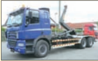
(22438) DAF CF 85.430 6x4 (E3+G1)

Abrollkipper EZ: 09/2005, zul. Gesamtgewicht: 26.000 kg, Nutzlast: ca. 13.120 kg, abgel. Km-Stand: 405.620 km, Federung: Blatt/Luft, Aufbau: Hyvalit Technamics 2060 S-Schubarm, Innenbedienung, 20to Hubkraft -6,5m Containerlänge, ausziehbarer Unterfahrschutz, 2-Leiter Luftanschluss, AHK, Längs- u. Quersperren, Diff.-Sperr HA, AP-Achsen, analoger Tacho, Schlafplatz, lg. Fahrerhaus, Bordcomputer, Radio, Motorbremse, Klima, Standheizung, EDC, ABS, Servo etc.