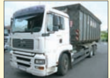
(Vol. 14+15+16) 3x vorhanden MAN TG-A 26.430 6x2 (E3+G1) Abrollkipper EZ: 12/2004-01.2005, zul. Gesamtgewicht: 26.000 kg, Nutzlast: 14.800 kg, abgel. Km-Stand: 309+330+405Tkm, Federung: Blatt/Luft, Aufbau: Meiller RK 20.70 für bis 7 m Container, 21.000 kg Hubkraft, Schubarm, Innenbedienung, Lg.Fhs/Liege, ABS, ASR, Klima, Dachluke, Radio, analoger Tacho,Lenk+ Liftachse, Diff.-Sperrung HA, AHK 2-Leiter Luftanschluss, etc.