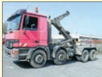
(22308) Mercedes Benz 4140 8x4 (E2+G1)

Abrollkipper EZ: 08.2004, zul. Gesamtgewicht: 26.000 kg, Nutzlast: 14.000 kg, abgel. Km-Stand: 460.250 km, Federung: Blatt/Luft, Aufbau: Hyvalit 20.60 S für bis 7 m Container, 20.000 kg Hubkraft, Schubarm, Innenbedienung, ausziehbarer Unterfahrschutz, hydr. Containerverriegelung, Zusatzhydraulikanalysen hinten, Sonnenblende, ABS, Klima, AHK 2-Leiter Luftanschluss.