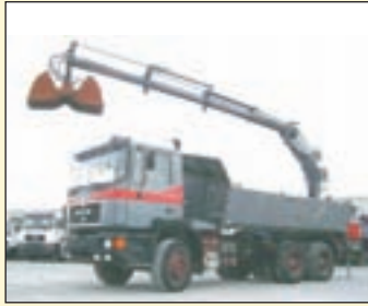
(20321) MAN 27.372 E (1) Kipper/Heckkran – absattelbar

EZ: 08/1995, zul. Gesamtgewicht: 26.000 kg, Nutzlast: 14.405 kg, abgel. Km-Stand: 384.830 km, Federung:Blatt, Aufbau: 3-Seiten-Aluminium-Palettenkipper, 2-teilige Bordwände (pendelnd/abklappbar), Baggerschutz. Kran: Hiab 105-3, absattelbar, faltbar, 3-fach hydr. Ausschub, re./li. Bedienung, 6. + 7. Steuerkreis. Hebt bei: 2, 1m - 4.400kg, bei 3, 6m - 2.600kg, bei 5, 8m - 1.600kg, bei 7, 6m - 1.200kg und bei 9, 0m - 950 kg, ABS, Diff.-Sperrung, AHK+2-Leiter Luft.