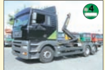
(22379) MAN TG-A 26.400 6x2 (E4+G1) Abrollkipper EZ: 06/2007, zul. Gesamtgewicht: 26.000 kg, Nutzlast: 14.590 kg, abgel. Km-Stand: 514.631 km, Federung: Blatt/Luft, Aufbau: Marrel Abrollkipper MA 26.70 für bis 6.5 mtr Container., 21.000 kg Hubkraft, Schubarm, Innenbedienung, abklappbarer Unterfahrerschutz ht. ABS, ASR, Tempomat, Standheizung, Klima, Diff.-Sperrung HA, AHK 2-Leiter Luftanschluss etc.