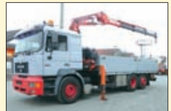
(21898) MAN 27.403 FL 6x2 (E2 + G1)

Pritsche/Kran EZ: 04.2005, zul. Gesamtgewicht: 7.490 kg, Nutzlast: 2.530 kg, abgel. Km-Stand: 209.520 km, Federung: Blatt/Luft, Aufbau: Pritsche (5,6m), Kran: Palfinger PK 3800, faltbar, re/li Bedienung, 2x hydr. Ausschub + 1x man. Ausschub, 6-Gang-Getriebe, ABS, Diff.-Sperr HA, Kugelkopf AHK etc.