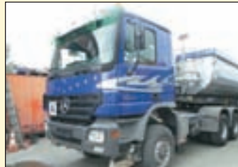
(22446) Mercedes Benz 3344 MP II AS 6x6 Allrad-Sattelzugmaschine/Kipphydraulik

EZ: 02/2000, abgel. Km-Stand: 455.500, Federung: Blatt, org. 33to Variaten 8to Vo-Achse, 13to Hinterachse etc. m/Fhs/Liege, Klimaanlage, Heckfenster, Verteilergetriebe, Sonnenblende, Luftansaug oben, Geländeuntersetzung, Fahrerluftsitz, Diff.-Sperrung Hinterachse, Diff.- Sperrung Vorderachse, Dachluke, Bordcomputer, AP-Achsen, ABS, 400 l Tank, etc. auf Wunsch dazu 22445 Meiller 2-Achs Stahlhinterkipmulde Halfpipe, Ez.: 07.2001 Luftfederung, ABS, abklappbarer Unterfahrschutz etc.