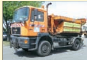
(22373) MAN 19.343 (E2+G1) Allrad Abrollkipper (Winterdienstausrüstung) EZ: 04/1997, zul. Gesamtgewicht: 18.000 kg, Nutzlast: 7.600 kg, abgel. Km-Stand: 282.219km, Federung: Blatt, Aufbau: Uima Abrollkipper BL 14 für bis 5 mtr Container, 12.150 kg Hubkraft, Knickarm, Innenbedienung, hydr. ausf. Unterfahrerschutz ht. Anbauplatte für Schneeschild mit Hydraulik- und E-Anschlüssen, Beilhack Schneeräumerschil PV 34-4, Räumbreite ca. 3.800 mm, Höhe ca. 1.100 mm, Beilhack Innenbedienpult, Zusatzhydraulikanchlüsse rechts, Zusatzscheinwerfer. Abrollcontainer mit Kupper Weisser Streuautomat (Tellerstreuer) STA95 E50HFFARK, Nutzinhalt ca. 4.5 m³, Innenbedienpult. ABS, AP-Achsen, Diff.-Sperrung HA, Geländeuntersetzung, Vo.-Achse zuschalbar, Nebelscheinwerfer, AHK, 2-Leiter Luftanschluss