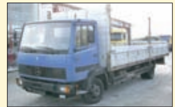
(21464) Mercedes-Benz 817 (E2) Pritschenwagen offen

EZ: 07/1989, zul. Gesamtgewicht: 5.600 kg, Nutzlast: 1990 kg, abgel. Km-Stand: 226.515 km, Federung: Blatt, Aufbau: Pritsche, nach hinten abgeschrägt (Auffahrhöhe ca. 600 mm), Plane + Spriegel, federentlastete Auffahrrampe.