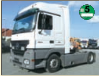
4x vorhanden (22403+22404+22406) Mercedes Benz 1844 (E5+G1) Sattelzugmaschine/Megaspace Lowliner Bereifung 295/60 R 22,5

EZ: 2006 + 2007, abgel. Km-Stand: ca. 500-600.000 km, Federung: Luft, Megaspace Fhs/2xLiege, ABS, ASR, Berganfahrhilfe, Tempomat, Standheizung, Klima, Retarder, elektr. Ausstelldach, Radio, Bordcomputer, Kühlschrank, Zentralverriegelung, Fahrerkomfortsitz, Sitzheizung, AP-Achsen, Diff.-Sperrung HA, Dach + Seitenspoiler, 400 l + 500 l Tank, Jost-Sattelkupplung etc.