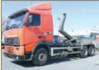
(22277) Volvo FH 12 420 6x2 (E1+G1)

Abrollkipper EZ: 09/2005, zul. Gesamtgewicht: 26.000 kg, Nutzlast: ca. 13.120 kg, abgel. Km-Stand: 405.620 km, Federung: Blatt/Luft, Aufbau: Hyvalit Technamics 2060 S-Schubarm, Innenbedienung, 20to Hubkraft -6,5m Containerlänge, ausziehbarer Unterfahrschutz, 2-Leiter Luftanschluss, AHK, Längs- u. Quersperren, Diff.-Sperr HA, AP-Achsen, analoger Tacho, Schlafplatz, lg. Fahrerhaus, Bordcomputer, Radio, Motorbremse, Klima, Standheizung, EDC, ABS, Servo etc.