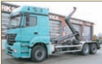
(22408+Vol.11) 2x vorhanden

Abrollkipper EZ: 04/1994, zul. Gesamtgewicht: 26.000 kg, Nutzlast: ca. 13.715 kg, abgel. Km-Stand: 574.749 km, Federung: Blatt, Aufbau: Meiller RK 19.70 S für bis 7 mtr Container, 20.000 kg Hubkraft, Schubarm, Innenbedienung, hydraulisch abklappbarer Unterfahrschutz ht. ABS, Standheizung, Klima, Liftachse, Diff.-Sperr HA, AHK 2-Leiter Luftanschluss