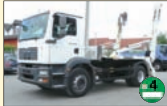
(22440) MAN TG-M 18.280 (E4 +G1) Absetzkipper EZ: 04/2008, zul. Gesamtgewicht: 18.000 kg, Nutzlast: 9.500 kg, abgel. Km-Stand: 106.388 km, Federung: Blatt, Aufbau: Meiller Telekopabsetzkipper 13to Hubkraft, Innen+Außenbedienung Servo, ABS, Fahrerairbag, EDC, Radio, Bordcomputer, AHK 2-Leiter Luftanschluss.