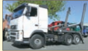
(22313) Volvo FH 12 420 6x2 (E3+G1) Absetzkipper EZ: 11/2005, zul. Gesamtgewicht: 26.000 kg, Nutzlast: 13.950 kg, abgel. Km-Stand: 279.760 km, Federung: Blatt/Luft, Aufbau: VDL P-18 T, teleskopierbar, 18.000 kg Hubkraft, Innen- u. Außenbedienung. ABS, Klima, autom.geregelte Zusatzbremse (VEB) 3 Stufig+Auto Modus, Lift/Lenkachse, Diff.-Sperrung HA, AHK 2-Leiter Luftanschluss