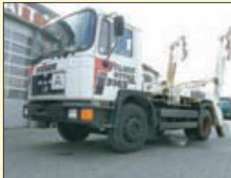
(20663) MAN 17.232 Absetzkipper EZ: 08/1990, zul. Gesamtgewicht: 17.000 kg, Nutzlast: 8.705 kg, abgel. Km-Stand: 349.042 km, Federung: Blatt, Aufbau: Atlas mit Innen- u. Außenbedienung. Diff.-Sperrung HA, AHK, 2-Leiter Luftanschluss, Preis 5.900,- Euro netto