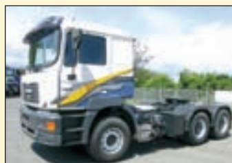
(20856) MAN 27.414 (E2 + G1) 6x4 Sattelzugmaschine

EZ: 01/2004, abgel. Km-Stand: 371.520, Federung: Blatt, org. 33to Variaten 8to Vo-Achse, 13to Hinterachse etc. m/Fhs/Liege, Verteilergetriebe, Sonnenblende, Radio, Nebelscheinwerfer, Luftansaug oben, Klimaanlage, Geländeuntersetzung, Fahrerluftsitz, Diff.-Sperrung Hinterachse, Diff.-Sperrung Vorderachse, Dachluke, Bordcomputer, Berganfahrhilfe, AP-Achsen, ABS, 400 l Tank etc. Auf Wunsch dazu 22447 Carnehl 2-Achs Halfpipe Stahlhinterkipmulde, Ez.: 04.2008, Luftfederung, ABS, abklappbarer Unterfahrschutz, etc.