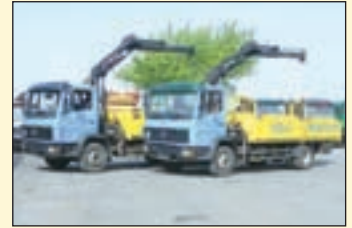
2x vorhanden (22309+22310) Mercedes Benz 1317 (E2+G1)

Abrollkipper/Kran EZ: 02/1997, zul. Gesamtgewicht: 26.000 kg, Nutzlast: 11.000 kg, abgel. Km-Stand: 421.713 km, Federung: Blatt, Aufbau: Hüffermann Typ HL 26.55 SN bis 6 mtr. Container, 18.000 kg Hubkraft, Schubarm, Innenbedienung, Kran: HMF 1483-K3, faltbar, 3-fach hydr. Ausschub, Funk + Flursteuerung. Hebt bei 4.4m-3.075kg, 6.4m-2.000kg, 8.5m-1.450kg, 10.6m-1.144kg. m.Fhs. AP-Achsen, AHK 2-Leiter Luftanschluss etc.