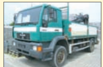
(22498) MAN 18.284 (E2+G1) 4x4

EZ: 06/2005, zul. Gesamtgewicht: 11.990 kg, Nutzlast: 4.910 kg, abgel. Km-Stand: 124.428 km, Federung: Blatt, Aufbau: Pritsche 5,5m, Kran: Hiab 085 B-2, faltbar, 2-fach hydr. Ausschub, re/li Bedienung, 6.+ 7. Steuerkreis für Drehservo- u. Steingängensteuerung. Hebt bei 2m-4t, 3.5m-2.4t, 5.5m-1.52t, 7.4m-1.12t. ABS, EDC, Tempomat, Radio, Beifahrersitzbank, Diff.-Sperr HA, Kugelkopfkupplung.