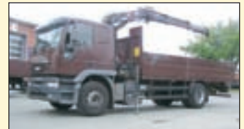
(21719) Iveco Magirus 190 E 31 (E3 + G1)

Pritsche/Kran EZ: 11/2003, zul. Gesamtgewicht: 18.000 kg, Nutzlast: 8.860 kg, abgel. Km-Stand: ca. 333.682 km, Federung: Blatt/Luft, Aufbau: Pritsche (6,2m), Kran: HIAB 095-2, faltbar, 2-fach hydr. Ausschub, 6. + 7. Steuerkreis für Drehservo- u. Steingängenbetrieb, re/li Bedienung. Hebt bei 3.3m-2.75t, 3.6m-2.57t, 5.3m-1.74t, 7m-1.3t. Gr.Fhs/Liege, ABS, ASR, EDC, Klima, Schlafplatz, Diff.-Sperr HA, AHK 2-Leiter Luftanschluss etc.