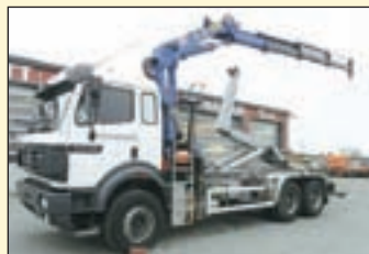
(22032) Mercedes Benz 2538 6x4 (E2 + G1)

Abrollkipper/Kran EZ: 06.2003, zul. Gesamtgewicht: 26.000 kg, Nutzlast: 11.620 kg, abgel. Km-Stand: 215.750km, Federung: Blatt/Luft, Aufbau: Hiab Multilift LHT 260 20to Hubkraft bis 6,5 m Container, Kran: Hiab 1660XS/E-2 Pro Hochsitz, Pilotsteuerung, 2x hydr.Ausschub, Drehservo+Greiferst. Megaspacer Fhs/2Liege, Klima, Standzh., Diff.-Sperr HA, AHK+2-Leiter Luftanschluss etc.