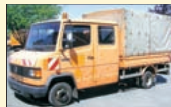
(21732) Mercedes-Benz 508 D Doppelkabine Pritschenwagen

EZ: 08/1990, zul. Gesamtgewicht: 4.600 kg, Nutzlast: 2.070 kg, abgel. Km-Stand: 234.084 km, Aufbau: Pritsche 3,1m, Alufächten mit Plane+ Spriegel +1340mm, Servo, Standheizung, 3. Tür, 7 Sitzer, AHK + Kugelkopfkupplung.