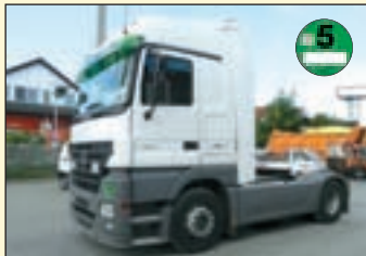
(22405) Mercedes Benz MP II 1844 (E5+G1) Sattelzugmaschine/Megaspace

EZ: 2006 + 2007, abgel. Km-Stand: ca. 500-600.000 km, Federung: Luft, Megaspace Fhs/2xLiege, ABS, ASR, Berganfahrhilfe, Tempomat, Standheizung, Klima, Retarder, elektr. Ausstelldach, Radio, Bordcomputer, Kühlschrank, Zentralverriegelung, Fahrerkomfortsitz, Sitzheizung, AP-Achsen, Diff.-Sperrung HA, Dach + Seitenspoiler, 400 l + 500 l Tank, Jost-Sattelkupplung etc.