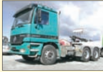
(20720) Mercedes-Benz 2657 (E2+G1) 6x4 Sattelzugmaschine (V8Motor)

EZ: 04.2006, abgel. Km-Stand: 704 + 777 + 794 TKM, Federung Luft, Jost Sattelkupplung, Super Space Fhs/2 Liegen, ABS, Standheizung, Klima, analoger Tacho, Fahrerkomfortsitz, Diff.-Sperrung HA, Spoiler, 1000 l Tank auf Wunsch dazu (22342-44) Schmitz 3-Achs Megatrailer/Tautliner li+re+Edscha (13600x2500x3000mm) ABS, Liftachse, SAF-Achsen, Stützwindwerk vorne, Abstützung hinten, Scheibenbremsen 445/19er Bereifung etc.