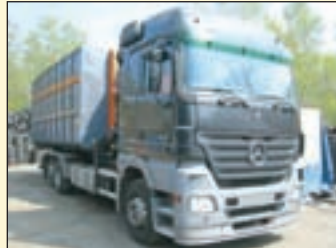
(Vol 12) Mercedes Benz 2546 6x2 (E3 + G1)

Abrollkipper EZ: 05/1998, zul. Gesamtgewicht: 32.000 kg, Nutzlast: 18.280 kg, abgel. Km-Stand: 465.687 km, Federung: Blatt, Aufbau: Atlas ARK 242 für bis 7 mtr Container, 24.000 kg Hubkraft, Knickarm, ABS, ASR, Klima, Rangiermaul