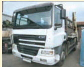
(Vol.17) DAF CF85/360 (E3 +G1) Absetzkipper EZ: 04.2004, Zul. Gesamtgewicht: 18.000 kg, Nutzlast: 9.240 kg, abgel. Km-Stand: 299.413 km, Federung: Blatt, Aufbau: Meiller Telekopabsetzkipper 13to Hubkraft, Innen+Außenbedienung Servo, ABS, EDC, Radio, Bordcomputer, AHK 2-Leiter Luftanschluss.