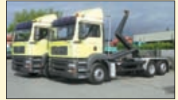
(22476+22477) 2x vorhanden MAN TG-A 26.350 6x2 (E3+G1) Abrollkipper EZ: 09+11.2005, Zul. Gesamtgewicht: 26.000 kg, Nutzlast: 15.090 kg, abgel. Km-Stand: 279+465Tkm, Federung: Blatt/Luft, Aufbau: Meiller RK 19.065 für bis 7 mtr Container., 21.000 kg Hubkraft, Schubarm, Innenbedienung ausziehbarer Unterfahrerschutz, m.Fhs/Liege, ABS, ASR, Klima, Dachluke, Radio, analoger Tacho, Lenk+Liftachse, Diff.-Sperrung HA, AHK 2-Leiter Luftanschluss, etc.