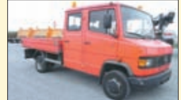
2x vorhanden (22434-435) Mercedes-Benz 609D Pritschenwagen

EZ: 1991/1992, zul. Gesamtgewicht: 5.600 kg, Nutzlast: 2.755 kg, abgel. Km-Stand: ca. 330.000 km, Aufbau: Offene Pritsche, Hartholzboden. Eckfenster, 3. Tür, Fahrerschwingsitz, Beifahrersitzbank, 7 Sitzer, AHK + Kugelkopfkupplung.