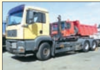
(22478) MAN TG-A 26.410 (E3+G1) 6x4

Abrollkipper EZ: 12/1998, zul. Gesamtgewicht: 26.000 kg, Nutzlast: 14.275 kg, abgel. Km-Stand: 509.597 km, Federung: Blatt, Aufbau: Meiller RK 19.65 S für bis 6,5 mtr Container, 20.000 kg Hubkraft, Schubarm, Innenbedienung, Anbauplatte für Schneeschild mit Hydraulik- u. E-Anschlüssen, Zusatzhydraulikanalysen rechts, ABS, ASR, Radio, AP-Achsen, Alutank, 300 l Tank, Tandem-AHK, 2-Leiter Luftanschluss, Hydraulikanalysen für Anhänger