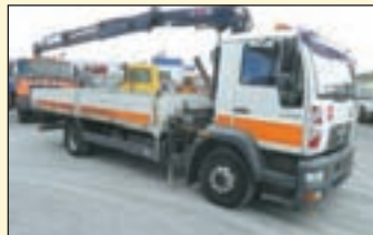
(22413) MAN 12.220 (E3+G1) Pritsche/Kran

Pritsche/Kran EZ: 03.1997, zul. Gesamtgewicht: 26.000 kg, Nutzlast: 11.940 kg, abgel. Km-Stand: ca. 600.646 km, Federung: Blatt/Luft/Lift, Aufbau: Pritsche (6,2m), Kran: Atlas AK 155.1, faltbar, 3-fach hydr. Ausschub, vollhydr. Abstützung, re/li Bedienung. Hebt bei 2m-6.8t, 4.3m-3.48t, 6.2m-2.33t, 8.1m-1.74t, 10.1m-1.36t.ABS, gr. Fhs/Liege, Standheizung, Klima, Diff.-Sperr HA, AHK + 2-Leiter Luft, Hydraulikanalysen für Anhänger etc