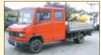
(21785) Mercedes-Benz 611D (E2) Doppelkabine Pritschenwagen

EZ: 1991/1992, zul. Gesamtgewicht: 5.600 kg, Nutzlast: 2.755 kg, abgel. Km-Stand: ca. 330.000 km, Aufbau: Offene Pritsche, Hartholzboden. Eckfenster, 3. Tür, Fahrerschwingsitz, Beifahrersitzbank, 7 Sitzer, AHK + Kugelkopfkupplung.