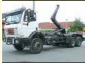
(22396) Mercedes Benz 2635 6x4 Abrollkipper

6x4 Abrollkipper EZ: 11.2005, zul. Gesamtgewicht: 26.000 kg, Nutzlast: 14.500 kg, abgel. Km-Stand: 265.000 + 275.000 km, Aufbau: Meiller RK 2065 für bis 6,5 m. Container, 20 to. Hubkraft, ausziehbarer U-Schutz, m Fhs., Telligent Getriebe, AP Achsen, Längs und Quersperren, Klima, AP Achsen, AHK + 2 Leiter Luft.