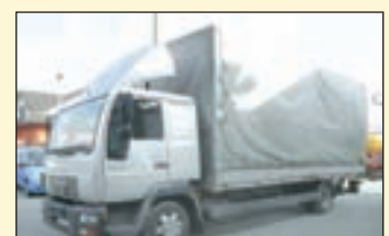
(22164) MAN 8.224 (E2+G1) Pritschenwagen/ LBW + gr. Fhs.

EZ: 01/1995, zul. Gesamtgewicht: 7.490 kg, Nutzlast: 2.675 kg, abgel. Km-Stand: 578.961 km, Federung: Blatt, Aufbau: offene Pritsche 7m. Zubehör: Servolenkung, Heckfenster, 3. Sitz, Anhängerkupplung, 2-Leiter Luft etc.