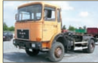
(21422) MAN 16.220 4x4 Allrad-Abrollkipper EZ: 07/1985, zul. Gesamtgewicht: 17.000 kg, Nutzlast: 7.850 kg, abgel. Km-Stand: 436.855 km, Federung: Blatt, Aufbau: Marrel Typ AMPL 1.140 für bis 5,20 Meter Container, Schubarm, Innenbedienung, Hydraulik & Verriegelung für Kranmulde, Servo, AHK 2-Leiter Luftanschluss, Hydraulikanchluss für Anhänger