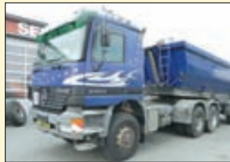
(22444) Mercedes Benz 3353 AS 6x6 (V8 Motor) Allrad- Sattelzugmaschine

EZ: 02/1999, abgel. Km-Stand: 378.534 km Federung: Blatt/Luft, ABS, ASR, EDC, Klima, Retarder, Fahrerkomfortsitz, Sitzheizung, Rampen und Weitwinkelspiegel, AP-Achsen, Längs- u. Quersperren, Alutank, 300 l Tank.