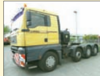
(22371) MAN 41.530 8x4 Schwerlast Sattelzugmaschine (Zuglast 120 to.)

EZ: 11/2000, Federung: Blatt/Luft, Standheizung, Zentralschmierung, Diff.-Sperrung, Liege, ABS, EDC, Retarder, Fahrerkomfortsitz, Sitzheizung, Längs+ Quersperren, 500 l Tank. Auf Wunsch dazu (20380) 48to Langendorf 3-Achs Tiefbettauflieger (hint. überfahrbar) EZ:06/2001, zul. Gesamtgewicht: 48.000 kg, Nutzlast: 33.400 kg, Federung: Luft, Tieflader in überfahrbarer Ausführung mit Tiefbett hydraulisch heb- u. senkbarer. Ladelänge: 14,8m (3,4m Podest vom + 6,5mTiefbett + 4,92m Podest hint. abgeschrägt, Beite 2.75m +klappbare Verbreiterung li+re um je 225mm. Ladehöhe: ca. 900mm, in Tiefbett 600 mm, 2fach hydr. Auffahrampen geknickt (Länge: 2.900 + 1.800mm) für niedrigen Auffahrwinkel Alle drei Achsen hydraulisch zwangsgeleitet und mit hydr. Nachlenkung über Funkfernsteuerung. ABS, Zentralschmierung, SAF-Achsen, Stützwindwerk vorn, Abstützung hinten, etc.