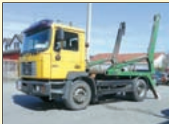
(22264) MAN 18.284 (E2+G1) Absetzkipper EZ: 05/2000, zul. Gesamtgewicht: 18.000 kg, Nutzlast: 9.060 kg, abgel. Km-Stand: 378.790 km, Federung: Blatt, Aufbau: Atlas ASK 133 T, teleskopierbar, 13.000 kg Hubkraft, Innen- u. Außenbedienung. ABS, EDC, Diff.-Sperrung HA, AHK 2-Leiter Luftanschluss