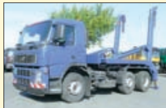
(22270) Volvo FM 12 380 6x2 (E3+G1) Absetzkipper EZ: 03/2004, zul. Gesamtgewicht: 26.000 kg, Nutzlast: 14.180 kg, abgel. Km-Stand: 256.582 km, Federung: Blatt/Luft, Aufbau: Meiller AK 15 MT, teleskopierbar, 15.000 kg Hubkraft, Innen- u. Außenbedienung. Zusatzhydraulikanchluss hinten. ABS, Klima, autom.geregelte Zusatzbremse (VEB) 3 Stufig+Auto Modus, Liftachse, Diff.-Sperrung HA, AHK 2-Leiter Luftanschluss, Duomatik Luftanschluss