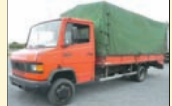
(22433) Mercedes-Benz 609 D (E2) Pritschenwagen mit Rampe

EZ: 09/1996, zul. Gesamtgewicht: 5.600 kg, Nutzlast: 2.580 kg, abgel. Km-Stand: 186.174 km, Aufbau: Pritsche 3 m, Stirnwand mit Rohrträgergestell, Servo, 3. Tür, Beifahrersitzbank, 7 Sitzer, AHK + Kugelkopfkupplung.